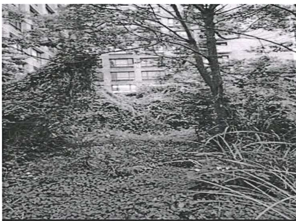
圖2 新竹市殯葬管理所指出古井童屍可能位置