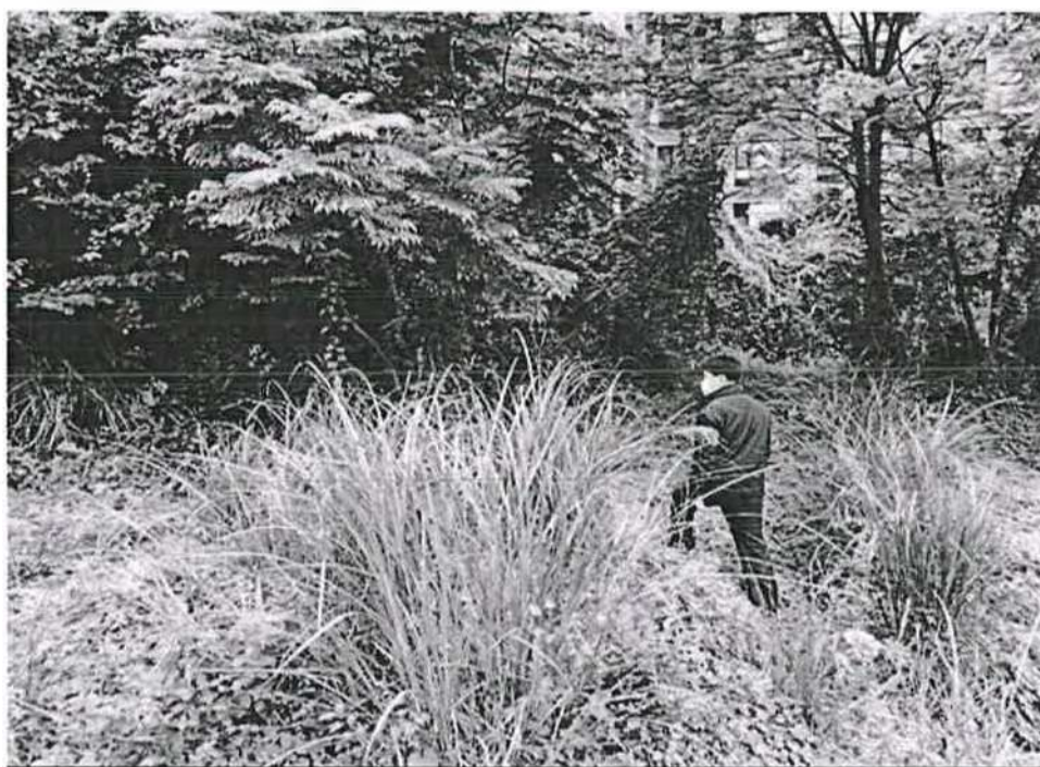
圖1 監察委員高涌誠至新竹市殯葬管理所找尋古井童屍